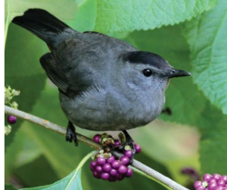
Gray Catbird on Beautyberry